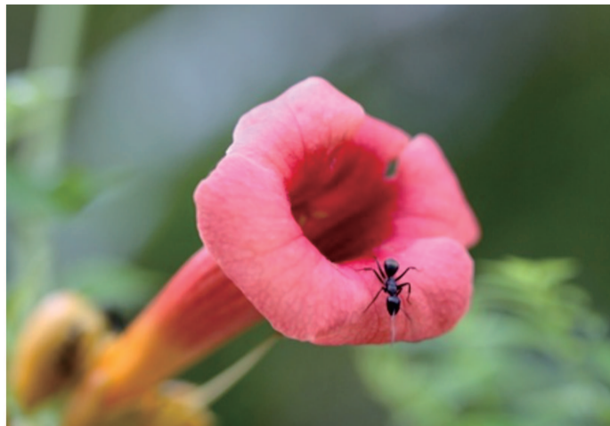
2018年8月24日摄于苏州公园一角 工会 蔡佩玲