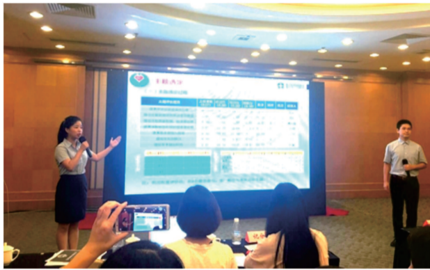
我院脉动圈斩获省品管圈大赛一等奖

8月18日，我院三个品管圈顺利通过省医院学会初审。为迎接江苏省品管圈大赛，院长张荣林、副院长李运红多次召开专题会议，对参赛人员进行指导和训练。我院参赛人员从课件制作、反复修改到现场展示，认真推敲。同时为了呈现出我院品管圈活动的精髓，参赛人员周而复始的进行彩排演练，不断磨合视频播放与演讲进度之间的契合度。期间，参赛人员借鉴其他医院品管圈汇报亮点，不断改进自身内容，最终我院品管圈团队用精美的PPT、精准的讲解，展示了我院医务人员良好的精神风貌，给评委们留下了深刻的印象，博得现场观众热烈掌声。“脉动圈”在256个参赛品管圈中脱颖而出夺得一等奖，充分展示了我院品管圈的实力和水平。 医务处 赵礼国