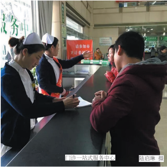
门诊一站式服务中心