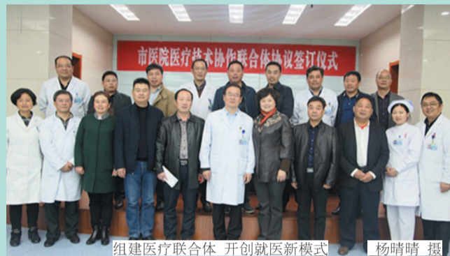
组建医疗联合体 开创就医新模式