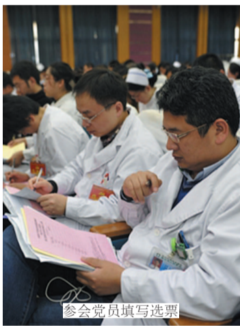
参会党员填写选票

11月15日下午,我院党委在门诊六楼会议室召开第三次党员大会,分别听取和审议上一届党委、纪委工作报告,并选举产生第三届委员会、纪律检查委员会。