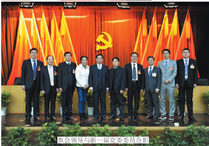
参会领导与新一届党委委员合影